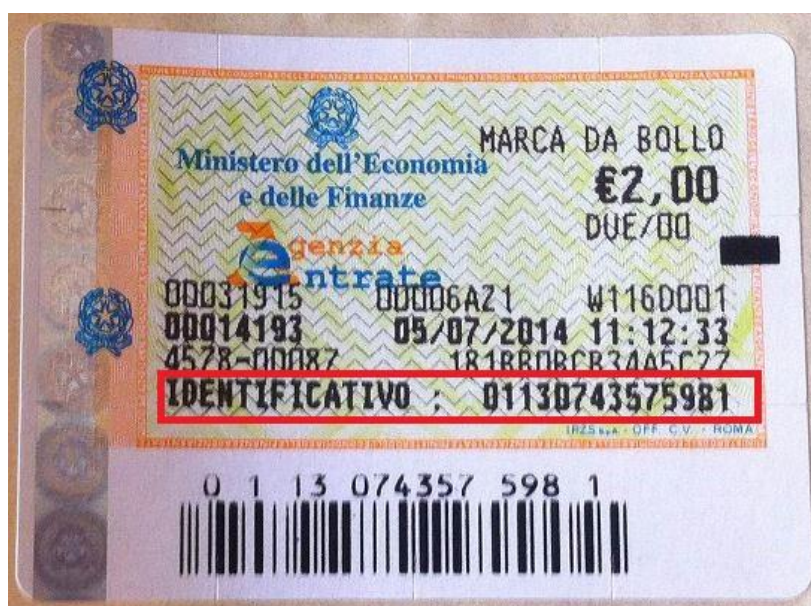
Figura 1: Marca da bollo

Come si può vedere in Figura 1, il codice è riportato sopra al relativo codice a barre.