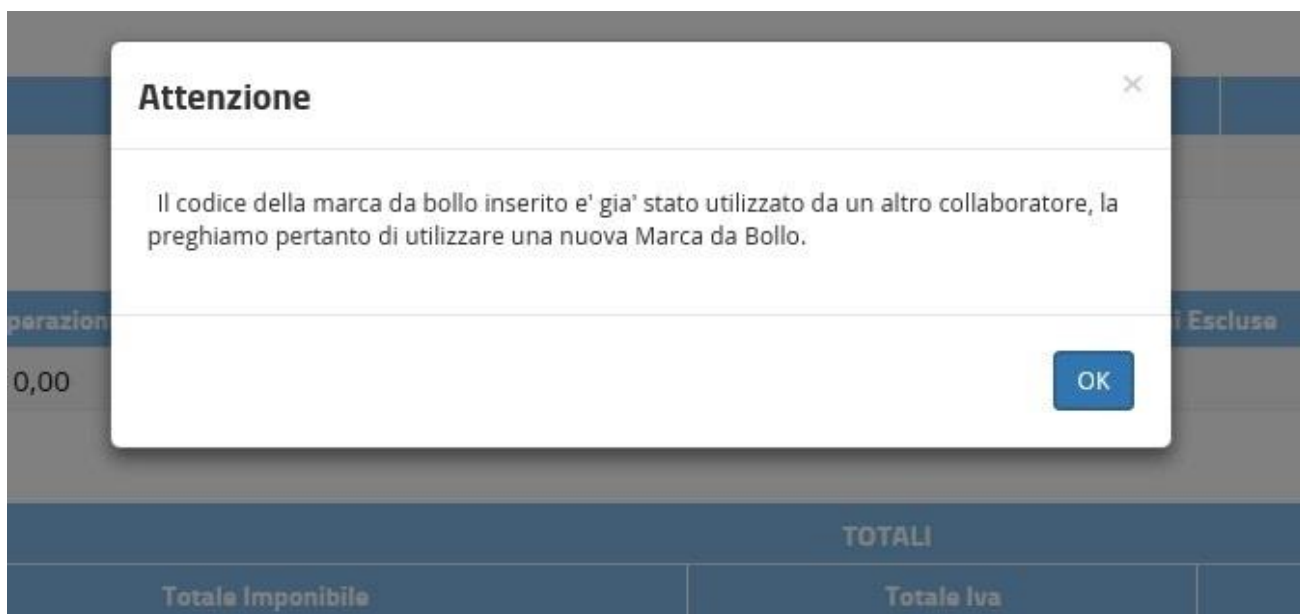
Figura 5: Popup duplicato generico

Nel caso in cui si tratti di una fattura di un altro collaboratore sarà invece presentata un blocco generico (si veda Figura 5).